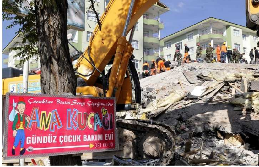
Vanyolu Camii karşı, yoldan görünüm.

Sabah Kriz Merkezi yerine kendi inisiyatifimiz ile enkaz dolaşmaya karar verdik. Vanyolu Camii karşındaki apartmana tekrar giderken yol üzerinde gördüğümüz ve tam olarak yıkılmayıp yan yatmış bir binayı (Mozaikli Bina) kontrol etmeye karar verdik. Burada Ankara İtfaiyesi ve Ersel'in tanıdığı bir ekip çalışıyordu. Binada bir alt kata galeriler ve döşemeler arası delikler açılmıştı. Köpeklerin dolaşması için idealdi. Burayı kontrol ettik ve bir sonuca ulaşamadık. İtfaiye ekipleri bizden sonra buldukları fakat çıkartmakla uğraşmadıkları bir cenazeye yoğunlaştılar. İtfaiye ekibinin de kendi köpeği olduğu ancak kafesinde bekletildiği görüldü.