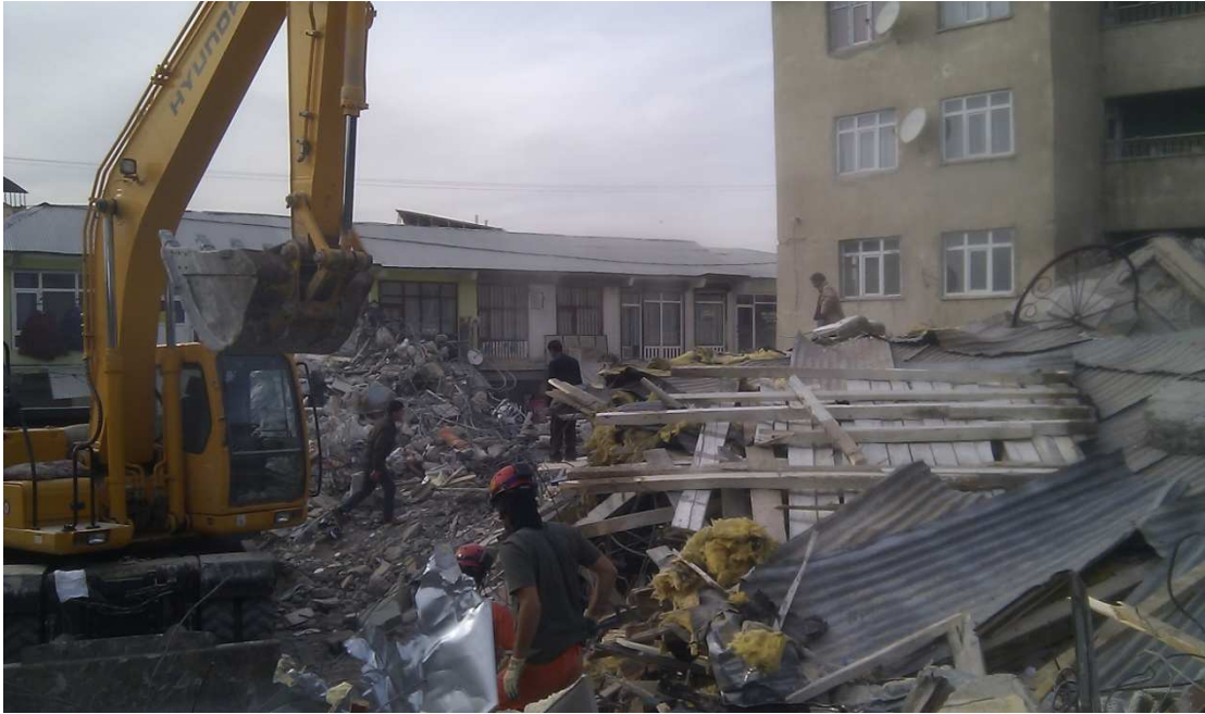
Çağdaş Giyim, Koç Apt. Karşısı'ndan bakış, görünmeyen karşı cephe yoldan 1-1,5 kat yüksekte