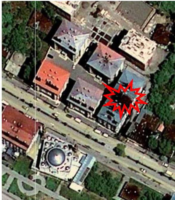
Vanyolu Camii karşısı