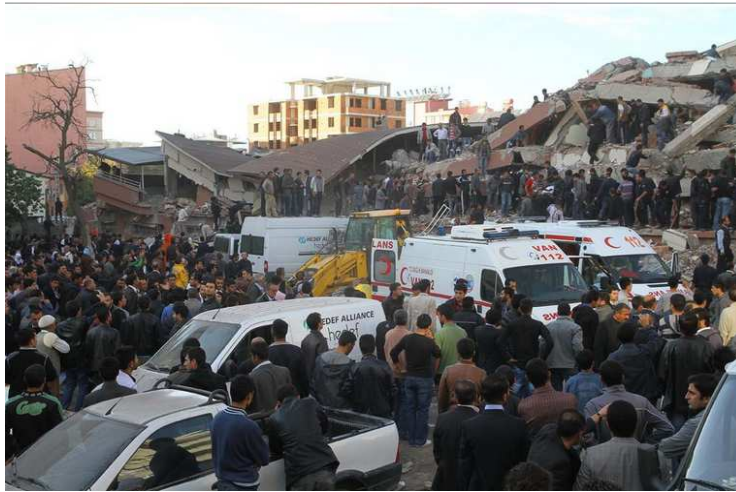
Enkaz üzerinde ve çevresinde karşılaşılan olağan kalabalığa örnek

Daha sonra Işıklar Apt. mevkiine geri dönüldü. Işıklar Apt. Yanından, daha önceki tarama güzergahının tersinden çalışmaya başlandı. Burada regülatörü takılı bir büyük boy bir mutfak tüpünün regülatörü söküldü. Işıklar Apt. enkazı üzerinde Oğlum aynı yerde 2 kez dönüp dönüp havladı. Bu sırada zaten enkazın diğer tarafındaki bir ekip sesini duydukları canlı bir depremzedeye ulaşmaya çalışıyordu (daha önce köpeklerin havlamadığı yer). Onlar çalıştıkları yerden 2 yaralı, bir de cenaze çıkardılar. Biz köpeklerin havladığı yere daha yakın olan yerde başka bir ekip ile çalışmaya devam ettik. Oğlum ayrıca ilk havladığı yere doğru yandan açılan bir tünelin içerisinde havladı, Akut'un köpeği de aynı yeri teyit etti. Birlikte çalıştığımız ekip daha sonra buradan iki cenaze daha çıkardı. Bu depremzedeler Oğlum havladığı zaman hayatta mıydı, yoksa köpek diğer tarafta üzerinde çalışılmakta olan depremzedelerin kokusunu mu aldı bilemiyoruz. Ayrıca buradan çıkan sese duyarlı bir oyuncak (ses gelince cıcıkleyen bir şey) bizlerin "acaba köpekler buna mu havlıyordu" diye kafamızı da karıştırdı ve üzdü.