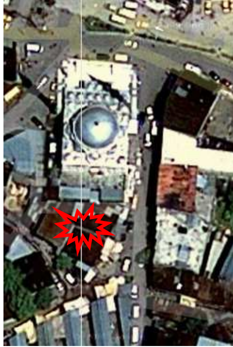
Büyük Camii arkası

çalışmalarına rağmen bir şey bulamadılar. Bu arada bizi çağıran ekibin enkazına Akut'un köpekleri girdi, o tarafa gitmemize gerek kalmadı.