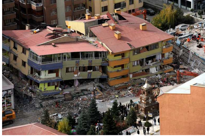
Mozaikli Bina, mavi balkonlu bina

Daha sonra Vanyolu Camii karşısındaki apartmana tekrar bakmaya karar verdik. Burayı elimizden geldiğince kontrol ettik, ancak bir sonuç alamadık. Bu binada cenaze kokusu çok baskındı.