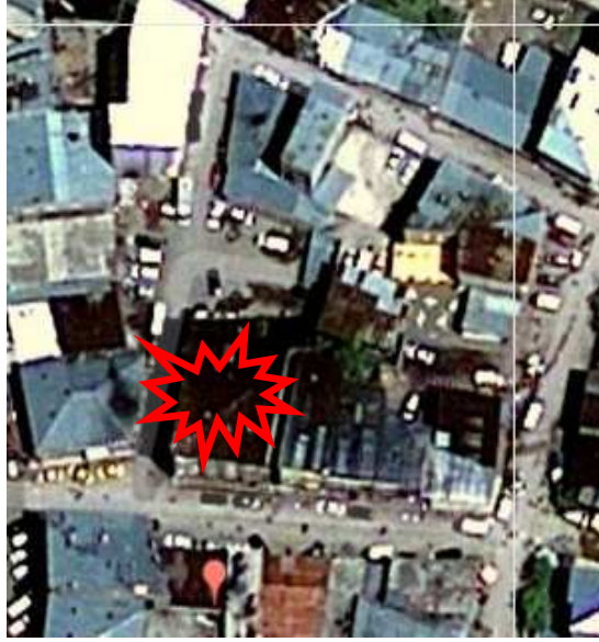
Erciř Hamamı üzerindeki bina

Bu binaya vardığımızda binanın önemli bir kısmının iş makinesi ile kazıldığını ve 9 adet cenaze çıkarıldığını öğrendik. Biz elimizden geldiğince her tarafından binayı taradık. Hava karanlıktı ve kafa fenerlerimizi kullanıyorduk. Buradan bir sonuç alamadık ama ağır cenaze kokusu bizlerin bile burnundaydı. Biz işimizi bitirirken apartmanın sahibi ikinci iş makinesini de getirdi ve artık enkazda gayet hunharca çalışmaya başladılar. Öyle ki koca döşeme parçalarını ekskavatörün kepçesi ile havaya kaldırıyor ve silkeleyerek parçalayıp enkazın üzerine yayıyorlardı. Sonra da kepçe ile kum gibi alıp bir kenara atıyorlardı. Apartman sahibinin bizi canlı bulmaktan çok, sert çalışabilmesi için teyit amaçlı çağırttığını hissettik. Burada daha fazla kalmayıp ayrıldık.