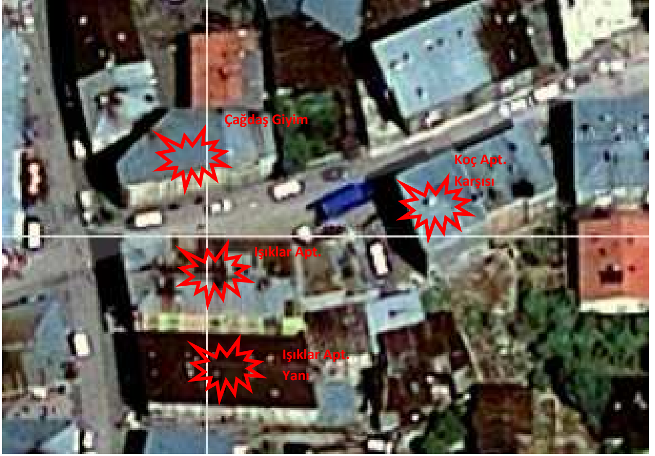
İlk çalışmanın yapıldığı bölge

İlk gittiğimiz yer görev kağıdımızda Koç Apt. olarak belirtilmişti. Ancak ne bizi getiren yerel vatandaş, ne de çevredekiler Koç Apt.'ının hangisi olduğunu bilemiyorlardı. Ortamda 4 tane enkaz halinde yapı vardı. Biz de birinden başlayarak 4 yapıyı da kontrol etmeye karar verdik. Binalara daha sonra kendi aramızda verdiğimiz kodlar aşağıdaki uydu görüntüsünde işlenmiştir.