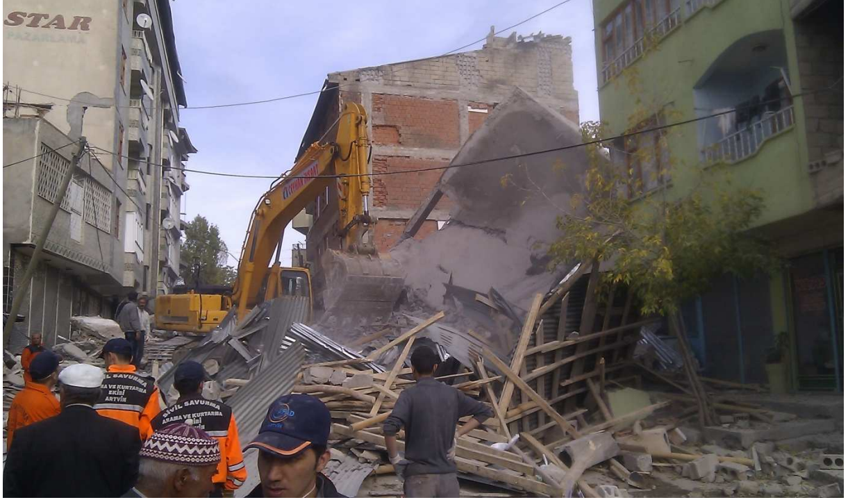
Koç Apt. Yanı kodlu bina. Tam karşısındaki binada "Koç Apt." Tabelası olduğunu sonradan fark ettik.

Burada ve daha sonraki enkazlarda çalıştıkça oturan eylem planımız şu şekildeydi. Önce çevredekilerden yapılan çalışma ile ilgili kaç kişi olmasından şüphe edildiği, o ana dek kaç kişinin çıkarıldığı gibi bilgileri alıyorduk. Köpekleri enkaza sıra ile çıkarıyor ve birbirlerini teyit etmelerini sağlamaya çalışıyorduk. Ancak ilk yapmamız gereken enkaz üzerindeki vatandaşları uzaklaştırmaktı ve bu her zaman zor oluyordu. Vatandaşları bir taraftan konuşarak ikna edip indirirken, diğer taraftan birisi eli cebinde molozların üzerine tüneviyeriyordu. İlk başlarda ortalıkta hiç asker/polis yoktu. Ancak daha sonraları bazı enkazların başına dikilmiş olan polis memurları bize bu konuda yardımcı oldu. Biz ayrılırken bu iş için askerlerden yardım istenmişti. Enkaz müsait hale geldikten sonra 1-2 koldan üzerine çıkıp köpekler için bir ön keşif yapıyorduk. Girilip bakılabilecek yerleri ve buraların güvenliğini denetliyorduk. Köpekler enkazda heyecan ile hareket ettiğinden kendilerini yaralamalarına neden olabilecek şeyleri mümkün olduğunca kaldırmaya çalışıp, onlar için verimli olacak güzergahı ve girip çıkabilecekleri kovukları belirlemeye çalışıyorduk. Köpekler çalışırken enkazın farklı köşelerinde durarak hareketlerini dikkatle izliyor ve gerektiği yerlerde köpekleri tutup kaldırıp engelleri aşırarak ve ya cesaretlendirerek yönlendirmeye çalışıyorduk.