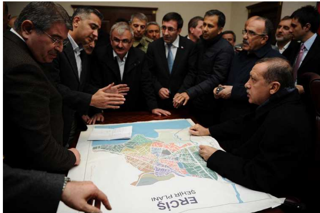
Bize verilmeyen ve kriz masasında kimsede olmayan şehir planını kimin aldığı sonradan ortaya çıktı